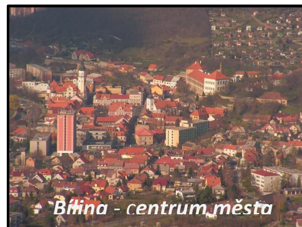
Bílina - centrum města