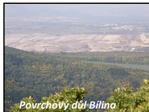
Povrchový důl Bílina